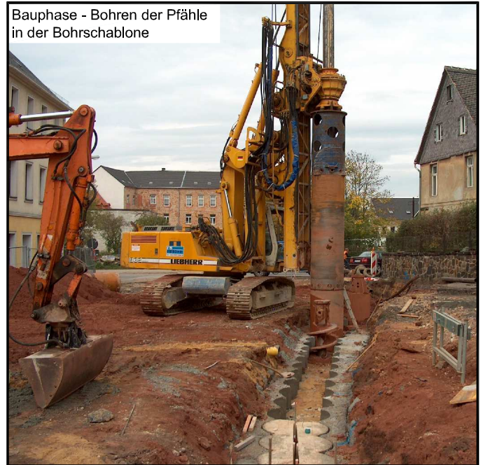
Bauphase - Bohren der Pfähle in der Bohrschablone

Bauwerksdaten: Tragwerk: überschnittene Bohrpfahlwand DU=880mm Stützweite: 5,75 m Lichte Weite: 4,75 m Lichte Höhe: 2,00 m Länge Bohrpfahlwand: 30,00 m Brückenfläche: 170,00 m 2